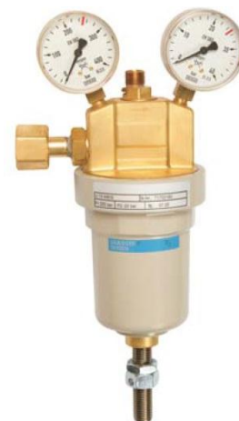
afbeelding 2 U13 zuurstof uitvoering