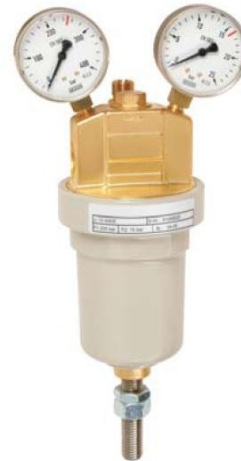
afbeelding 1 U13

Voor correct functioneren van de drukregelaar, dient men gebruik te maken van aansluitkoppelingen met snuffelboring. ( zie bestelgegevens)