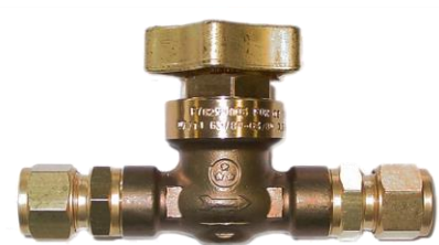
Model CAS 7806 t/m 7815