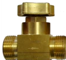
Model CAS 7868