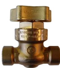
Model CAS 7829