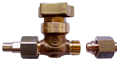
Model CAS 7828